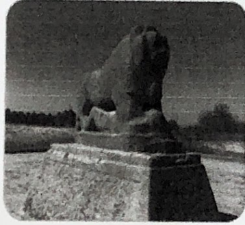
٢- اسد بابل

( و ) لاحظ الصور التي أمامك ثم اكتب اسم المعلم الحضاري التابع لها أسفل كل صورة ص ٧٢-٧٣ ( ٣ درجات لكل نقطة درجة )