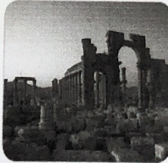
٣- آثار تدمر